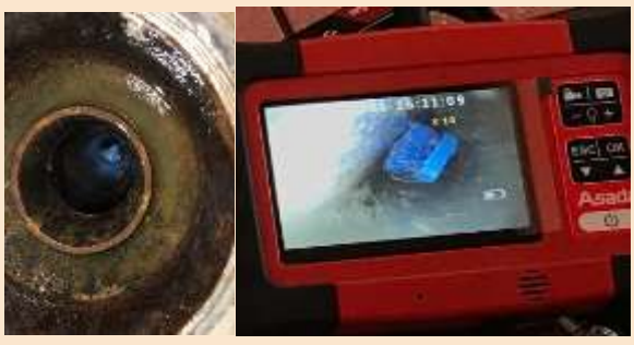
左側の写真は浴室排水口。直径は10cmあります。奥の方に目視で確認できます。右の写真は業者が持ってきた排水管の中を確認するカメラの映像です。蓋や釣り鐘を外してトラップ内のゴミをとることをお願いしていますが、絶対に落とさない、流れない用具を使用して細心の注意を払って作業をしてください。

みなさんはそれぞれに気を付けているはずだし、事故が起こる度に対策や手順の強化を行っていると思えます。今回なぜ、わざわざ排水口の上でブラシに付いた髪の毛を取っていたのか？疑問が沸きます。デッキブラシが流れるわけじゃないか：正直、私も流れる備品だと認識しておりませんでした。通常よりかなり大きな排水口です！今後の更なる注意事項をしっかりと守り作業をお願いします。こうもなると素人では取れませんし、使用すれば見えない場所までブラシが流れ更に奥