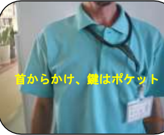
首からかけ、鍵はポケット