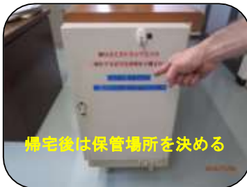
帰宅後は保管場所を決める