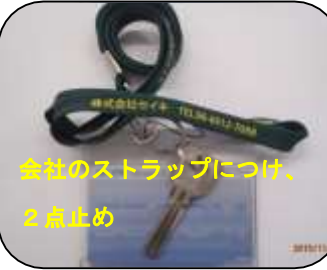
会社のストラップにつけ、2点止め