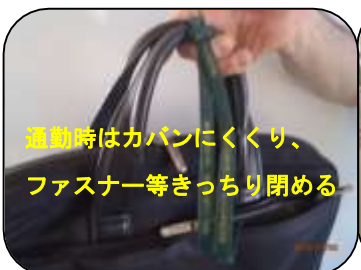
退勤時はカバンにくくり、ファスナー等きっちり閉める

セイキのストラップをもらっていない方は、担当社員まで報告をお願いします。すぐにお渡しします。