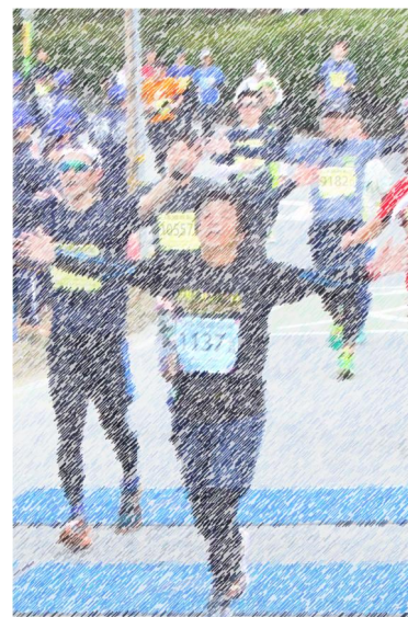
2017 篠山 ABC マラソンフィニッシュ！